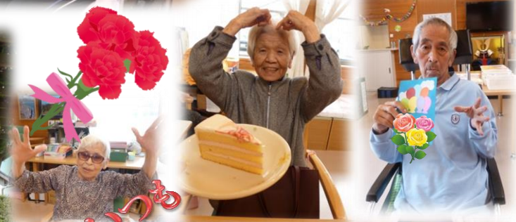
お母さんいつも ありがとうございます